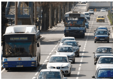
Os TUB faturaram no ano passado 7,2 milhões de euros

TRANSPORTES No último ano, os autocarros dos Transportes Urbanos de Braga (TUB) transportaram 12,4 milhões de pessoas, mais cerca de 500 mil do que em 2018. Trata-se de um crescimento de 3,99% no número de passageiros, que resultou na venda de 6,5 milhões de euros em títulos. Incluindo os alugueres das viaturas, os TUB faturaram 7,2 milhões de euros, o que contribuiu para acabar o ano com um resultado líquido de quase 54 mil euros.