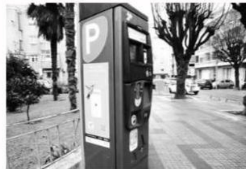
EUB garante que todos os parquímetros da cidade estão operacionais

Parte das artérias que, em Março de 2014, foram retiradas da então concessão do estacionamento, voltaram a ser taxadas. São os casos das ruas dos Bombeiros Voluntários, Carvalhal, S. André, Adaltiva Vieira e Diu, entre outras. Troços das ruas Frei Caetano Brandão, 25 de Abril e Américo Ferreira de Carvalho voltam a ter parquímetros.